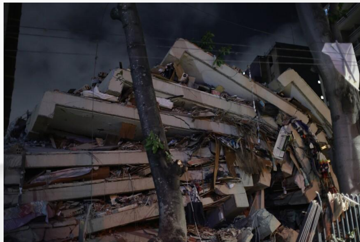
Edificio dañado en Los Palos Grandes, Chacao, Caracas / Damaged building in Los Palos Grandes, Chacao, Caracas

By the morning of June 26, the Venezuelan presidency reported 589 deaths and nearly 2,900 injured, while search-and-rescue operations continued in collapsed buildings. At the time, 157 people were officially listed as missing, although volunteer missing-person platforms report many more.