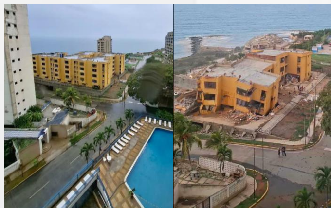
Antes y después de edificio en sector Playa Grande, La Guaira / Before and after of a building in Playa Grande sector, La Guaira

At least 346 structures have been affected, including 250 buildings, eight hospitals (some of which have been evacuated) and several shopping centers. La Guaira state has been declared a disaster zone; in areas such as Macuto, it is estimated that at least ten buildings have completely completely collapsed, and many of the remaining ones are heavily damaged..