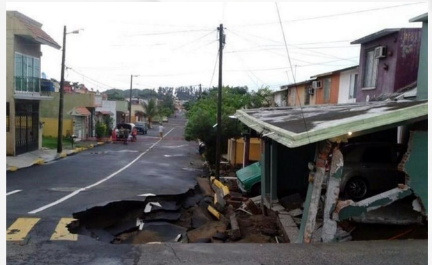
Figura 2. Colapso de una vivienda en la colonia Infonavit Río Medio.

En la zona conurbada de Veracruz-Boca del Río , se presentaron daños de asentamientos en dos fraccionamientos. Este hundimiento afectó a 10 viviendas en las colonias Infonavit Buena Vista y Lomas de Río Medio .