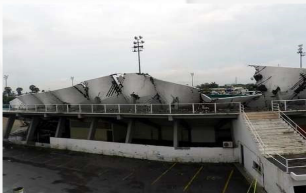
Figura 5. Derrumbe del techo del estadio de béisbol Praxedis Balboa, Ciudad Victoria.

En la ciudad de Llera se registró un deslave que dañó ductos con fibra óptica y afectó al servicio de telefonía en los municipios de Ocampo, Xicoténcatl, Güemez, Tula, Farías, Mante y Nuevo Morelos .