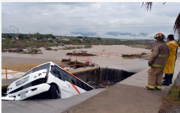
Figura 4. Vado de la colonia Moderna.

En Ciudad Victoria , los remanentes de Dolly ocasionaron el derrumbe del techo del estadio de béisbol Praxedis Balboa y la caída de un autobús en un hueco a la altura de un vado en la colonia Moderna . También se presentaron problemas de encharcamientos.