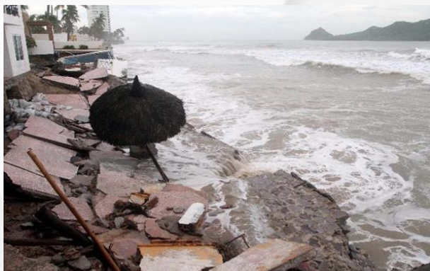
Figura 7. Parte de los daños provocados por Norbert en el puerto de Mazatlán.

Se presentó el desbordamiento del arroyo El Zopolite, ubicado a la altura de Portugués Gálvez , en Guasave.