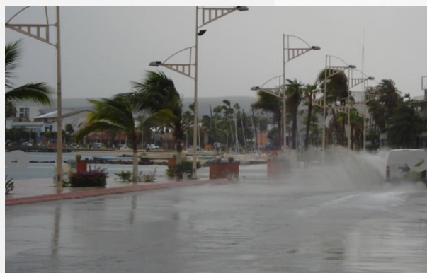
Figura 6. Las mayores lluvias se presentaron en las localidades de Puerto Cortés, Insurgentes, San Carlos, López Mateos, La Poza Grande y las zonas serranas del municipio de Comundú.

También causó afectaciones en los municipios de Mulegé y Comundú .