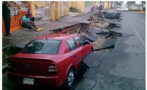
Figura 3. Daño en la colonia Infonavit Buenavista, debido a una zanja dejada por obras de la CFE.

Al menos cuatro vehículos también resultaron afectados en el fraccionamiento Buena Vista , debido a trabajos inconclusos en las obras del cableado subterráneo a cargo de la Comisión Federal de Electricidad, que produjo el socavón de una calle completa.