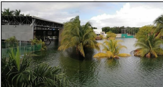
Inundaciones por lluvias en Mérida

Dentro de los daños reportados también se encuentran inundaciones en Cancún, Cozumel y Playa del Carmen, Quintana Roo, además de presentarse en algunas zonas del norte de Mérida, así como lo muestra el siguiente video. Zonas inundadas en Mérida