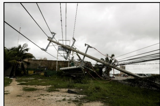
Daños en postes del sistema eléctrico (Cancún, Quintana Roo)