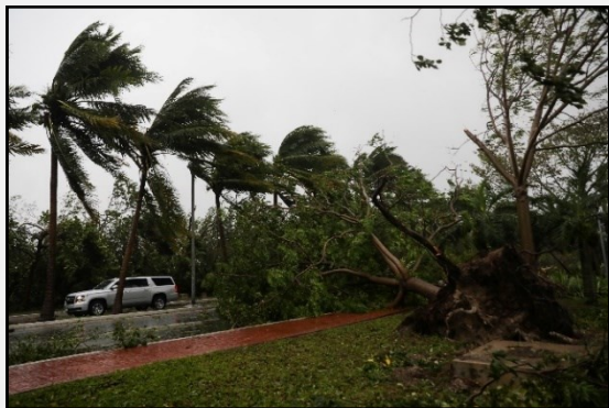
Árboles caídos (Cancún, Quintana Roo)