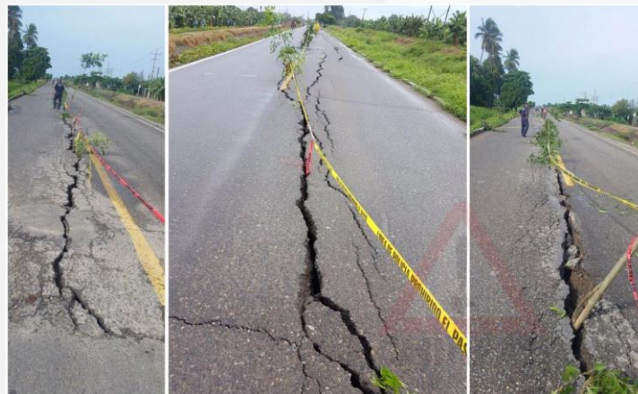
Daños en carretera/Road damages

The highway of Hidalgo City, Chiapas, was affected.