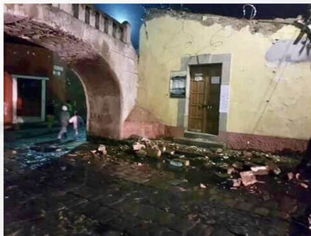
Daños en edificaciones de mampostería Damages in masonry buildings

A pesar de que el evento no causó daños mayores, de acuerdo con el Servicio de Geológico de los Estados Unidos (USGS), el movimiento fue reportado por 664 personas en más de 50 ciudades cercanas.