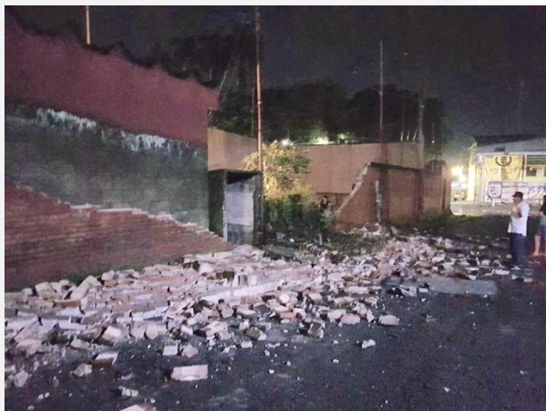
Daños en edificaciones de mampostería en San Marcos, Guatemala Damage in masonry buildings in San Marcos, Guatemala

Se presentaron daños debido a caído de estructuras metálicas. Damage occurred due to falling of metal structures.