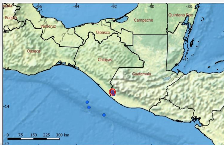
Mapa de ubicación del sismo y réplicas M > 5.0 / Earthquake location map and aftershocks with M > 5.0