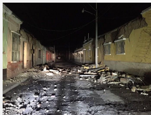
Daños en San Marcos, Guatemala Damages in San Marcos, Guatemala

Although the event caused minor damages, according to the United States Geological Service (USGS), the earthquake was reported by 664 people in more than 50 cities.