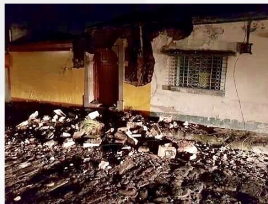
Daños en San Marcos y Quetzaltenango Damages in San Marcos & Quetzaltenango