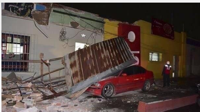
Daños en San Marcos, Guatemala Damages in San Marcos, Guatemala