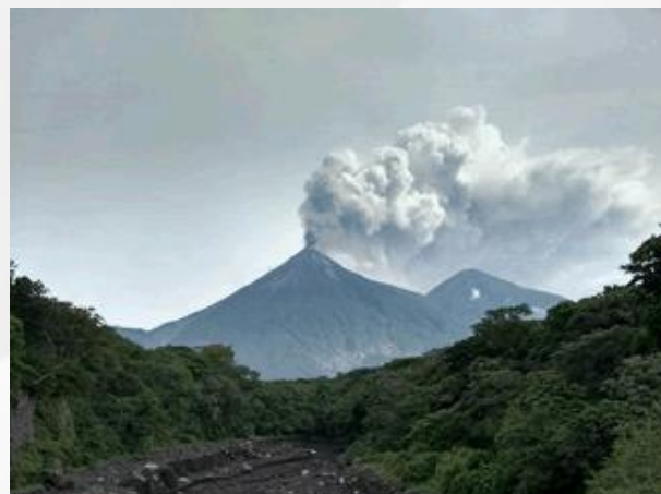
Erupción de Volcán de Fuego / Eruption of Volcano of Fire