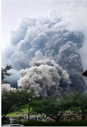
Erupción de Volcán de Fuego / Eruption of Volcano of Fire

The most lethal is not the lava but the pyroclastic flows; the gases reached a temperature of 700°C. A fiery cloud moved at a speed of 100 km/h sweeping everything, this video shows the displacement of the ash cloud.