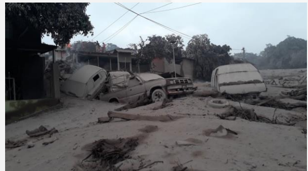
Huella tras erupción y daño por cenizas Trace after eruption and damage by ashes