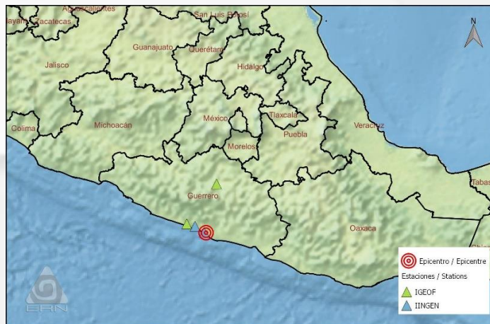
Mapa de ubicación del sismo / Earthquake location map