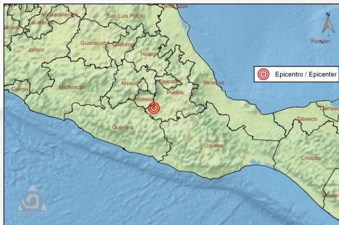
Mapa de ubicación del sismo / Earthquake location map