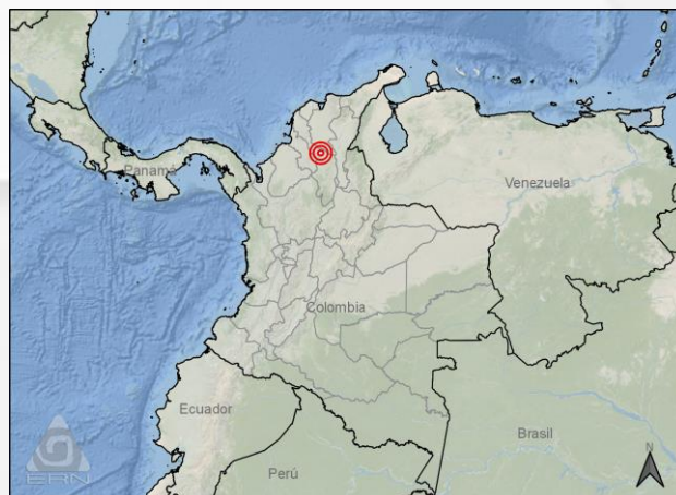
Mapa de ubicación del sismo / Earthquake location

During early morning of April 15 th , a moderate magnitude earthquake occurred in Northern Colombia. The ground shaking intensities predicted by ERN's earthquake model were validated against the reported accelerations finding good agreement.