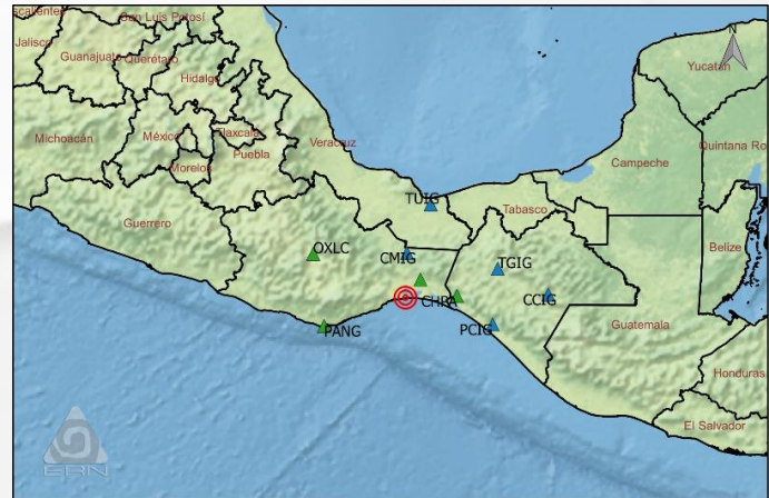
Mapa de ubicación del sismo / Earthquake location map