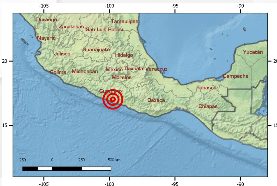
Mapa de ubicación del sismo / Earthquake location map

Elaboró / Elaborated by: Alejandro Aguado Sandoval ( alejandro.aguado@ern.com.mx )