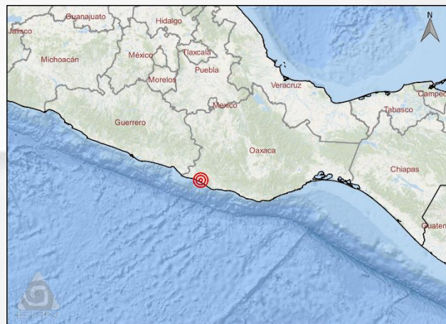
Mapa de ubicación del sismo / Earthquake location map